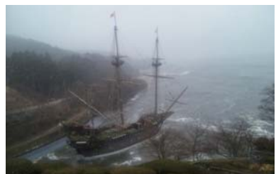
東日本大震災では大津波の直撃を受けた

パウティスタ。威風堂々としたその佇まいは、かつて命がけで海を渡った、常長をはじめとする男たちの勇姿と重なる。