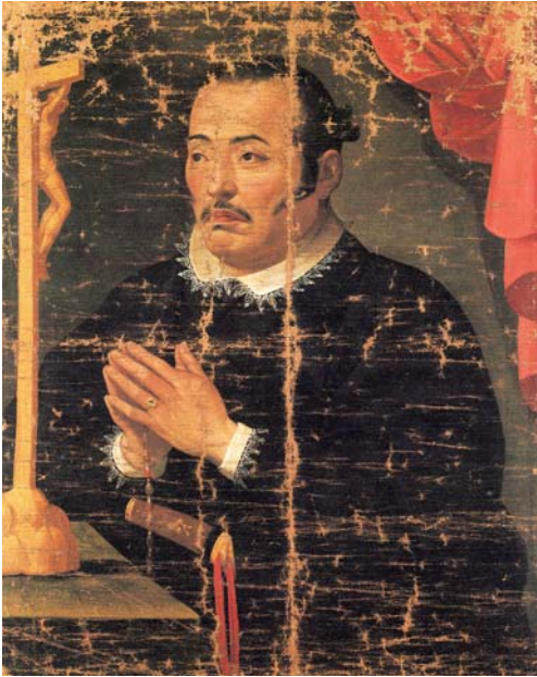
支倉常長像 (国宝・ユネスコ記憶遺産) 仙台市博物館蔵